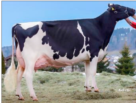
Goldwyn Melodie, S. Baume, Les Breuleux.